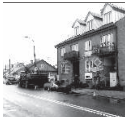
Przy ulicy Lubelskiej trwa remont chodnika.