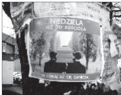
Na miejskich słupach, tablicach ogłoszeń i drzewach pojawił się nietypowy plakat związany prawdopodobnie z akcją społeczną.