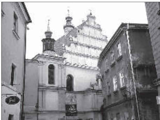
Przy kościele dominikanów w Lublinie poszukiwaliśmy tzw. Wieży Dominikańskiej.

W sobotę 14 grudnia br. przed Bramą Krakowską w Lublinie rozpoczęła się kolejna „Noc Jagiellońska”. Fundacja „Via Jagiellonica” zaprosiła wszystkich chętnych na ostatnie zwiedzanie z cyklu wielkich odkryć w sztuce. Dotychczas uczestnicy comiesięcznych spotkań mieli możliwość zapoznać się z widokiem Lublina z dzieła Brauna i Hogenberga, kościołem pobrygidzkim z freskami przedstawiającymi orszak królewski, kamienicą Rynek 8 z polichromiami ukazującymi widok miasta (Galeria Sceny Plastycznej KUL) i motywy renesansowe („Pawlica Pod Fortuną”) oraz kamienicą Rynek 6 (rodziny Madejskich). Nowa propozycja natomiast dotyczyła przede wszystkim architektury.