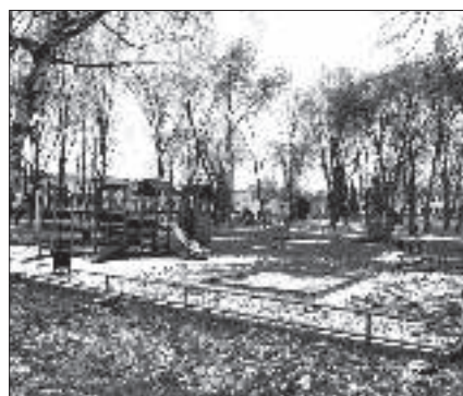
Tak wyglądał 5 grudnia w parku miejskim - pierwszy śnieg w tym sezonie.