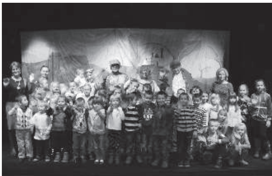
Wspólne zdjęcie z aktorami po spektaklu sprawiło ogromną radość wszystkim dzieciom