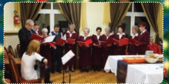
czyt. str. 4