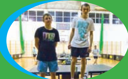
czyt. str. 10