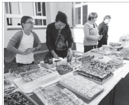
Kilkanaście rodzajów wymienionych ciast, swojski smalec przygotowali rodzice uczniów z babińskiej szkoły. W czasie biesiady można było także skosztować kiełbasek i mięsa z grilla.