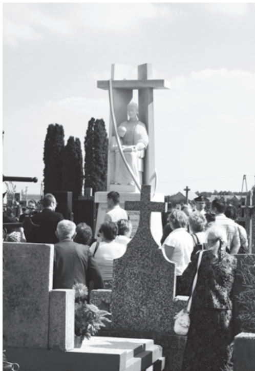
Pomnik Stefanii z Cieciszowskich Sienkiewiczowej na cmentarzu w Okrzei

Następnie na cmentarzu w Okrzei miało miejsce uroczyste poświęcenie pomnika matki największego polskiego pisarza. Obelisk ukazuje matkę Henryka Sienkiewicza, Stefanię z młodym synem u boku. Za nimi stoi podwójny krzyż. Na